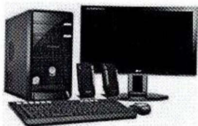
Figuras meramente ilustrativas